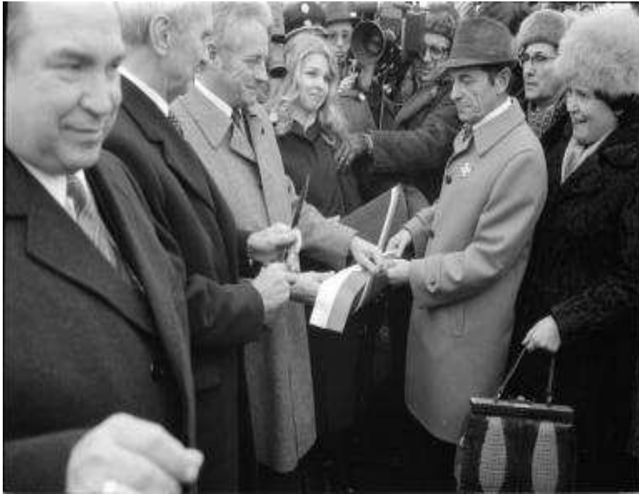
Die „neue“ Reichs- Brücke wird eröffnet (8. November 1980)