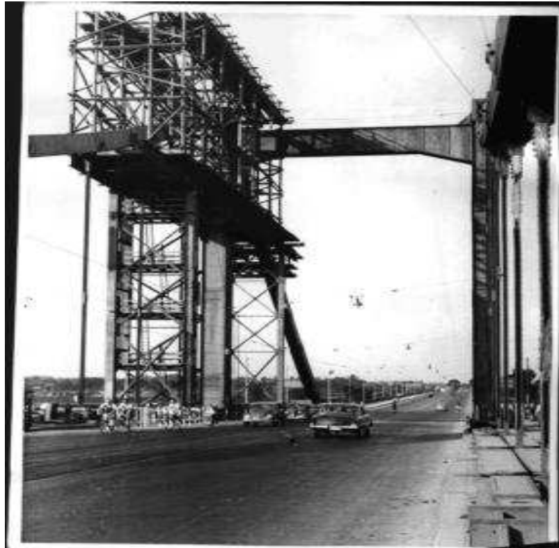
Wieder- Aufbau 1949