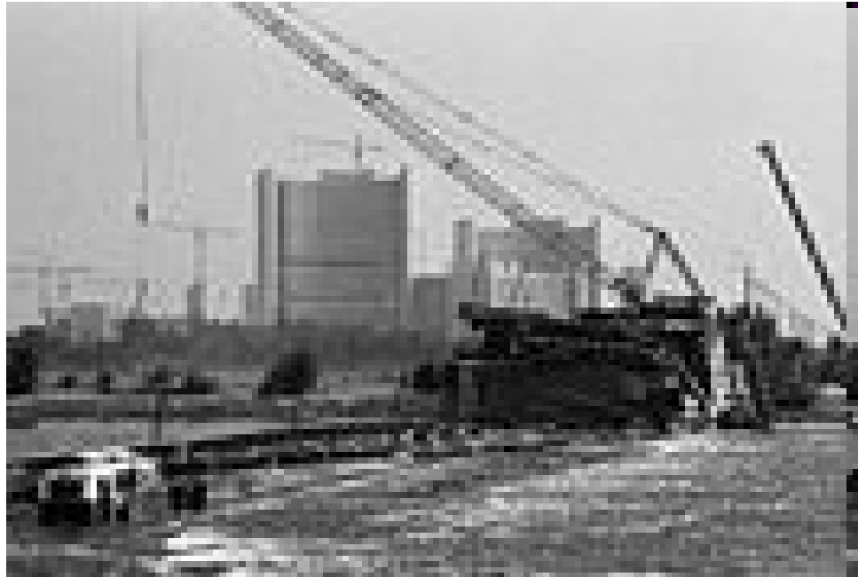
Die Reichsbrücke ist eingestürzt! 1. August 1976