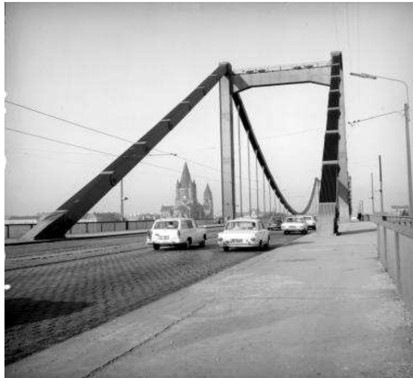
Reichsbrücke in den 70er-Jahren