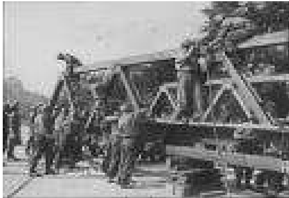
Eine provisorische Brücke entsteht (1976)