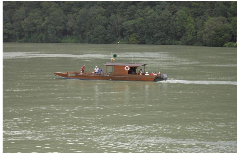
Eine Zille in der Schlögener Schlinge, 2009

Aus: Gemeinde-Infoblatt Marktgemeinde Hofkirchen i. M. (gekürzter Auszug)