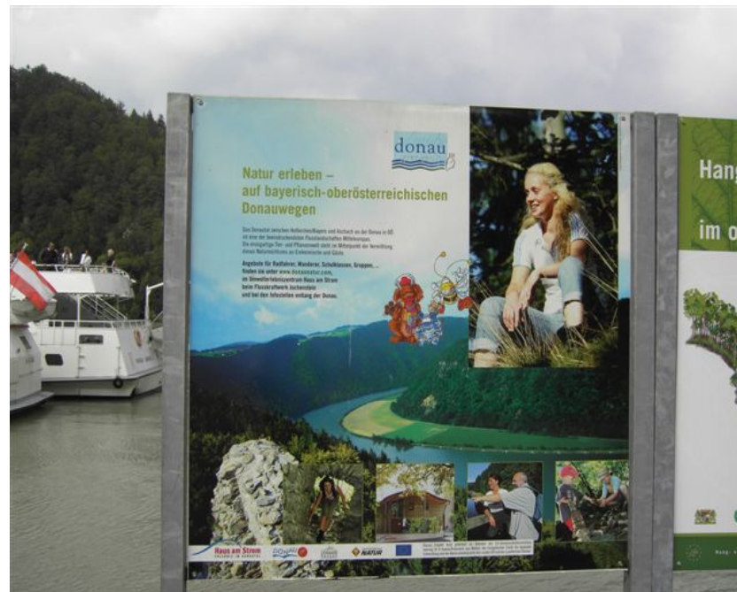
a barge in the Schlögenger Schlinge (Schlöggen Loop)

Especially in the Schlögenger Donauschlinge, a nature jewel, this barge port offers an extremely important tourist attraction.